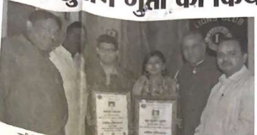
टॉपी में मेधावी विद्यार्थियों का सम्मान करते लार्यस क्लब के पदाधिकारी।

गौरव से नुराज्य में हुआ कार्यक्रम में किया था दोनों टॉप